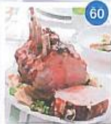
60 Menu di festa in famiglia o con gli amici