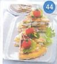
44 Con 44 euro sei ricchi piatti per tutti i giorni