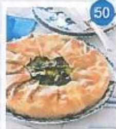
50 Torte pasqualine liguri diverse da zona a zona

Non solo di pasta all'uovo, ma anche di crespelle. Farciti con carne bianca, formaggi freschi e verdure di stagione